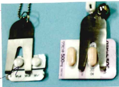
(B) 本具裏からの見た状態